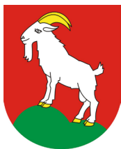
Obec Velké Karlovice