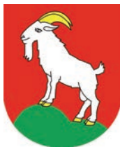
Obec Velké Karlovice